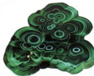
Малахит Гумешевского рудника