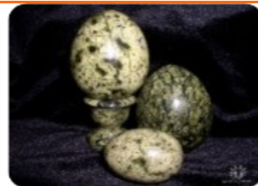
Серпентинит - Змеевик, поделочный камень