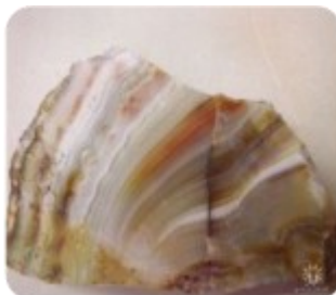
Агат-переливт. Средний Урал