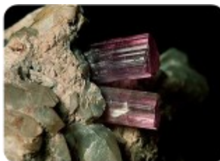
Столбчатые кристаллы розового турмалина