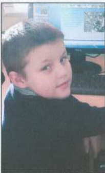
Илья Кошелев автор сказки